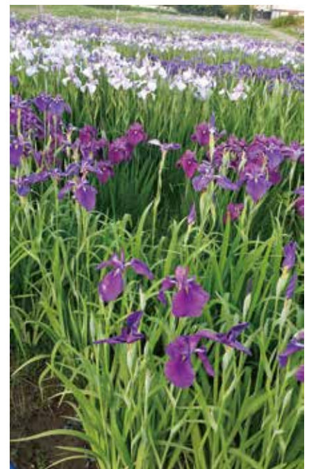
訪ねたあやめ園では、沢山のあやめや花菖蒲が咲き誇っていました。

外出はあくまでも手段の一つに過ぎないかもしれませんが。しかしフォーレストでは生活のほとんどを在宅で過ごされる療養者様が何かしたいと思う気持ちを尊重し、療養者様と家族と私達が、どうすればそれが出来るのかを一緒に考え、実現するまでの時間を共有し、療養者様の力となる支援者でありたいと思っています。